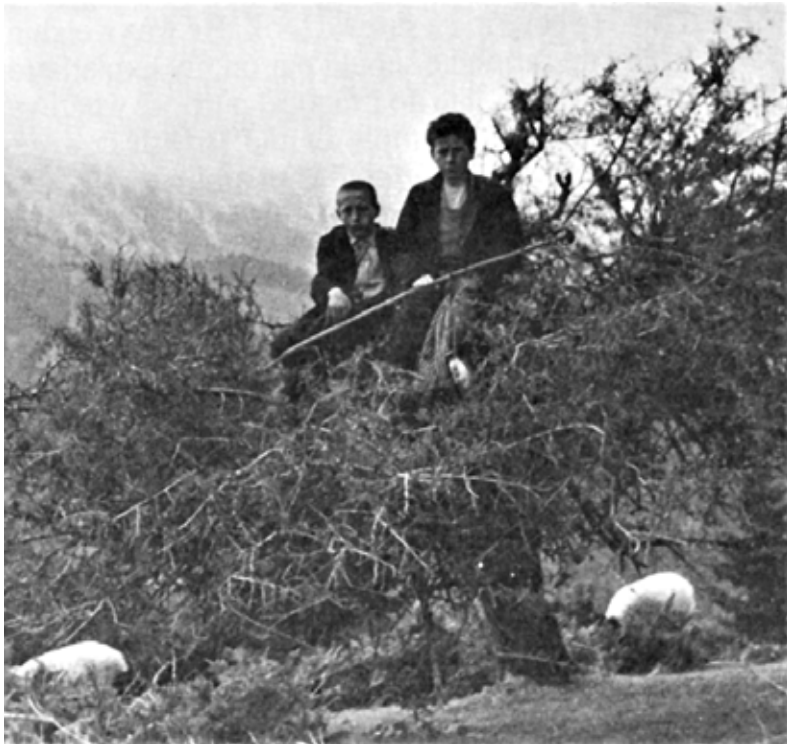
Έφηβοι βοσκοί στην Νεραίδα. αρχές Οκτώβρη 1943

* «Άγγελος Ζαχαρόπουλος. Τα ταραγμένα χρόνια 1940-1950. Άγραφα Εφηβικές μαρτυρίες και αναμνήσεις», σελ.69 -72, εκδόσεις ΜΙΝΩΑΣ, 2008.