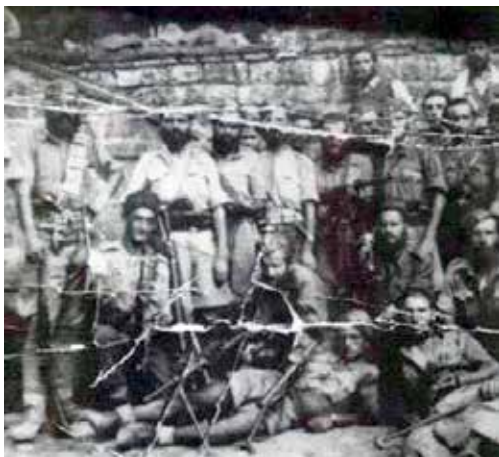
Οι πρώτοι αντάρτες του Κωστόπουλου (ΕΣΑΠ)

Τον Οκτώβριο του 1942 του ανατέθηκε η αρχηγεία του ΕΛΑΣ με υποσχετικό υπονοούμενο να γίνει και πρωθυπουργός μετά την λήξη της Κατοχής. Ωστόσο ο Κωστόπουλος γρήγορα διαφώνησε με τον τρόπο λειτουργίας του ΕΛΑΣ (ήταν αντίθετος με την κομμουνιστική ιδεολογία), διέβλεπε την προσπάθεια χειραγώγησής του, γι' αυτό και διέλυσε το αντάρτικο τμήμα του.