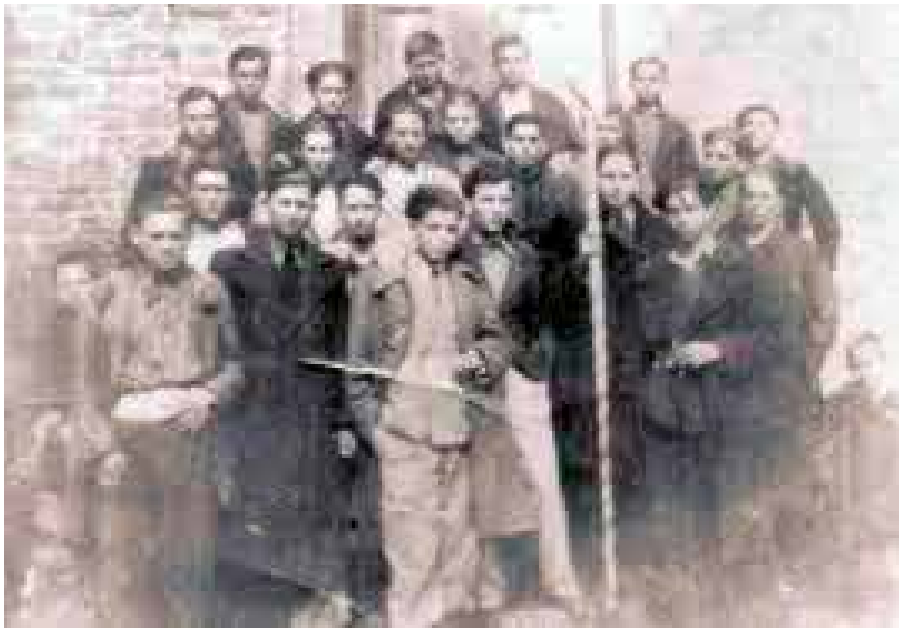
Νέοι της ΕΠΟΝ Μεσενικόλα, 1943