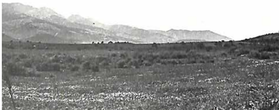
Ο χώρος της Νευρόπολης στον οποίο κατασκευάστηκε ο Αντάρτικος αεροδιάδρομος

Τα Άγραφα ήταν η καρδιά της αντίστασης και η Καρδίτσα, σε απόσταση μόλις 25 χιλιομέτρων, το οικονομικό κέντρο που τροφοδοτούσε την αντίσταση. Το καλοκαίρι