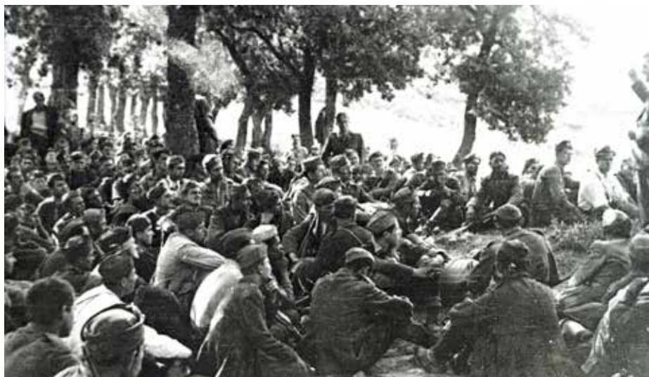
Στιγμιότυπο από το Α' Πανθεσσαλικό Συνέδριο ΕΑΜ

Το 1943 έδειχνε ότι θα είναι μια ελπιδοφόρα χρονιά για την Εθνική Αντίσταση, καθώς τα χωριά της Νευρόπολης συμμετείχαν σύσσωμα στο αντάρτικο το οποίο γιγαντώθηκε. Στις 12 Μάρτη 1943, τμήματα του ΕΛΑΣ κατεβαίνουν από τα ορεινά και απελευθερώνουν την Καρδίτσα από τους Ιταλούς, καθιστώντας την ελεύθερη πρωτεύουσα της Ευρώπης, όπως ανέφερε το BBC αναγγέλοντας την είδηση. Την ίδια εποχή στο οροπέδιο της Νευρόπολης κατασκευάζεται το αντάρτικο «αεροδρόμιο – φάντασμα». Στις 26 Ιουλίου του 1943, συνέρχεται το Α' Πανθεσσαλικό Συνέδριο του ΕΑΜ, με συμμετοχή 4.000 αντιπροσώπων απ' όλες τις ΕΑΜικές οργανώσεις της Θεσσαλίας στο μοναστήρι της Κορώνας.