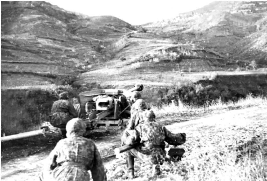
Γερμανοί κάτω από τον Άγιο Γεώργιο Βουνεσίου, πριν τη Γέφυρα "Μύλου Παπαδούλη" στοχεύουν τον Μεσενικόλα στο βάθος, ενώ δέχονται επίθεση από αντάρτες που είναι οχυρωμένοι στη θέση "Τσιούκα" Μεσενικόλα.

Τον Νοέμβρη του 1943, οι Γερμανοί στο πλαίσιο των εκκαθαριστικών επιχειρήσεων «Πάνθηρ» αποφασίζουν να καταστρέψουν το σύνολο των χωριών για να καταστείλουν την Αντίσταση. Οι επιχειρήσεις διήρκησαν από 27-11-1943 έως 3-12-1943 και τις έκαμε η διαβόητη μεραρχία «Εντελβαϊς».