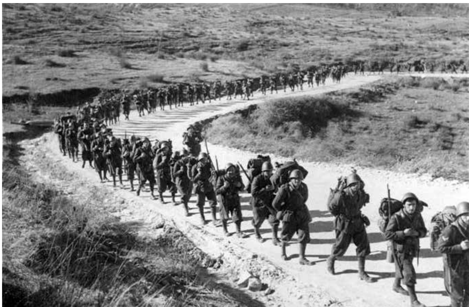
Πορεία των Ιταλών πριν τη μάχη της Πόρτας (Πύλη Τρικάλων)

σύνταγμα πεζικού, ένα σύνταγμα ιππικού και μία πυροβολαρχία (συνολική δύναμη 4000 ανδρών περίπου, που πλαισιώνονται και από τριακοσίους λεγεωνάριους). Καθελώνονται όμως στα στενά της Πόρτας Τρικάλων από οχυρωμένη δύναμη τριακοσίων μόλις ανταρτών, από εκείνους που είχαν έλθει τελευταίοι στην περιοχή από τα βουνά της ανατολικής Θεσσαλίας διασχίζοντας την πεδιάδα. Οι Ιταλοί είχαν στο πεδίο της τριήμερης μάχης απώλειες σε νεκρούς και τραυματίες πάνω από τριακοσίους άνδρες. Περισσότεροι από είκοσι Ιταλοί σκοτώθηκαν μόνοι τους όταν εξερράγη ένα δικό τους πυροβόλο. Τελικά δεν κατάφεραν να μαζέψουν ούτε τους νεκρούς τους και έτσι για πολλές μέρες μετά οι αγρότες ανακάλυπταν στα χωράφια πτώματα Ιταλών σε αποσύνθεση.