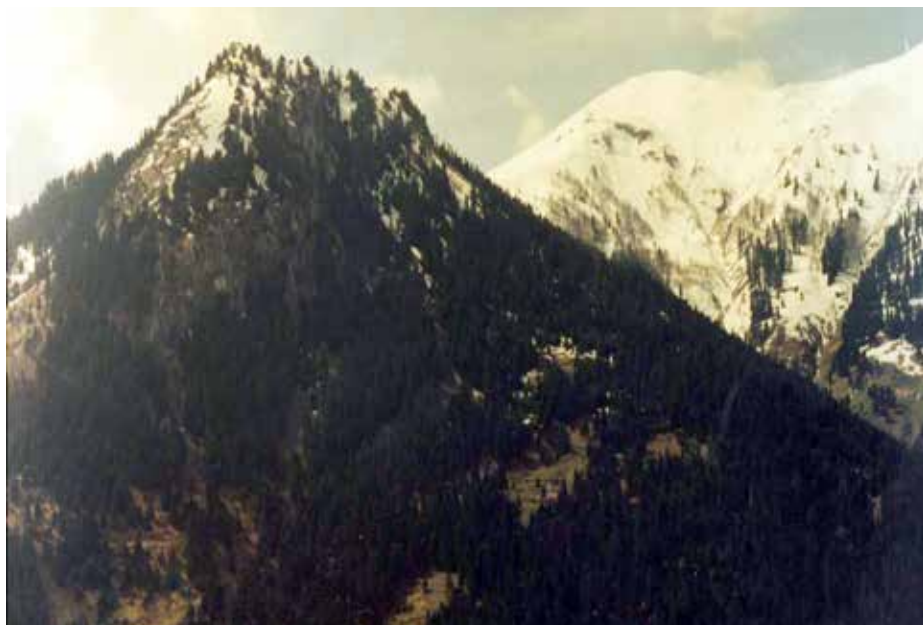
Το βουνό "Αράπης" της Καρύτσας, που φιλοξένησε στα δάση του χιλιάδες καταδιωκόμενους απ' τους Γερμανούς κατοίκους πολλών χωριών της περιοχής μας.

θηκολόγησαν με τους συμμάχους, αποχώρησαν απ' τον Άξονα και στις 11-10-1943 κήρυξαν κι αυτοί τον πόλεμο κατά της Γερμανίας. Αμέσως οι Γερμανοί πήραν στον έλεγχο τους τη διοίκηση της επαρχίας Καρδίτσας απ' τους Ιταλούς, που την εγκατέλειψαν πανικόβλητοι παίρνοντας τα βουνά και αποφάσισαν να αφανίσουν τα ορεινά χωριά, που υποστήριζαν και τροφοδοτούσαν την αντίσταση των ανταρτών εναντίον των κατακτητών με άνδρες και εφόδια. Το έργο ανέλαβε η περιβόητη μεραρχία «ΕΝΤΕΛΒΑΪΣ», η οποία δημιούργησε πολλές πάνοπλες ομάδες κρούσης (τάγματα) που κατευθύνθηκαν ταυτόχρονα προς τα ορεινά χωριά των Αγράφων της Καρδίτσας από πολλά και διαφορετικά σημεία.