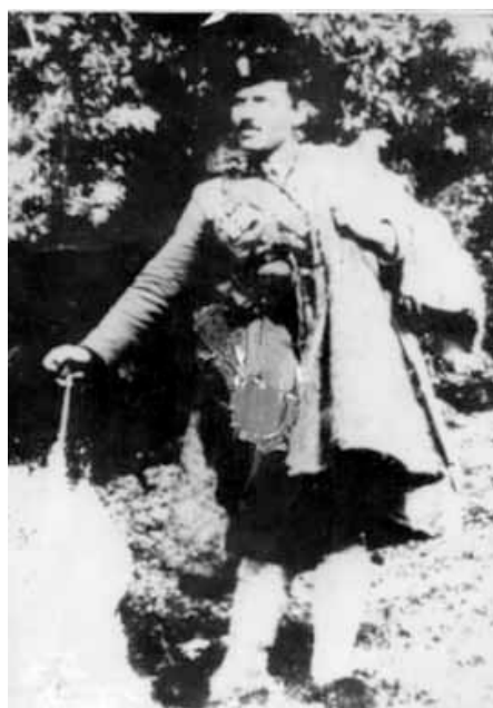
Ο καπετάν Κόζιακας (αριστερά) και ο Νικηταράς (Κώστας Καφαντάρης)

Στο μεταξύ την ίδια ώρα στο Μεσενικόλα συνεδρίασε η οργάνωση του ΕΛΑΣ και αποφάσισε με ψήφους 5-2-, να αφοπλίσουν τον Κωστόπουλο, παρά την άρνηση του Νικηταρά, ο οποίος υποστήριζε ότι θα έπρεπε να σεβαστούν ότι είχε ήδη δεσμευτεί για φιλοξενία, μαζί του συμφωνούσε και ο Ίταμος. Από το Μεσενικόλα φεύγουν αντάρτες του ΕΛΑΣ και με μία αστραπιαία κίνηση, στις 3 τα ξημερώματα πιάνουν κυριολεκτικά στον ύπνο τους άντρες του Κωστόπουλου, τους παίρνουν τα όπλα, τους συλλαμβάνουν και τους οδηγούν στο Δημοτικό Σχολείο του χωριού. Με το ξημέρωμα (3/3/1943) μαθαίνει ο υπομοίραρχος Δημήτρης Βιλαέτης για τον αφοπλισμό του Κωστόπουλου και σπεύδει με την ομάδα του προς απελευθέρωση. Γράφει ο Αγαπητός – Κυρίτης Δημήτρης, Το Μορφοβούνι (Βουνέσι) στην Αντίσταση και τον Εμφύλιο – Ο Αφοπλισμός του Κωστόπουλου, σελ. 74 – 75: