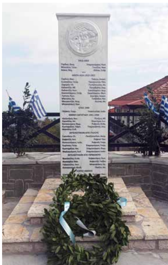
Μνημείο Πεσόντων στους Εθνικούς Αγώνες στο Μορφοβούνι, 2022.