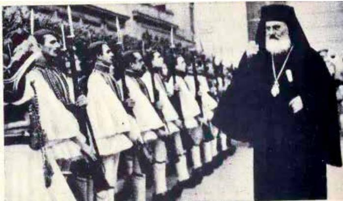
Ο Αρχιεπίσκοπος Δαμασκηνός, 30/12/1944 ορίζεται Αντιβασιλέας και αποδίδονται τιμές από Εύζωνους