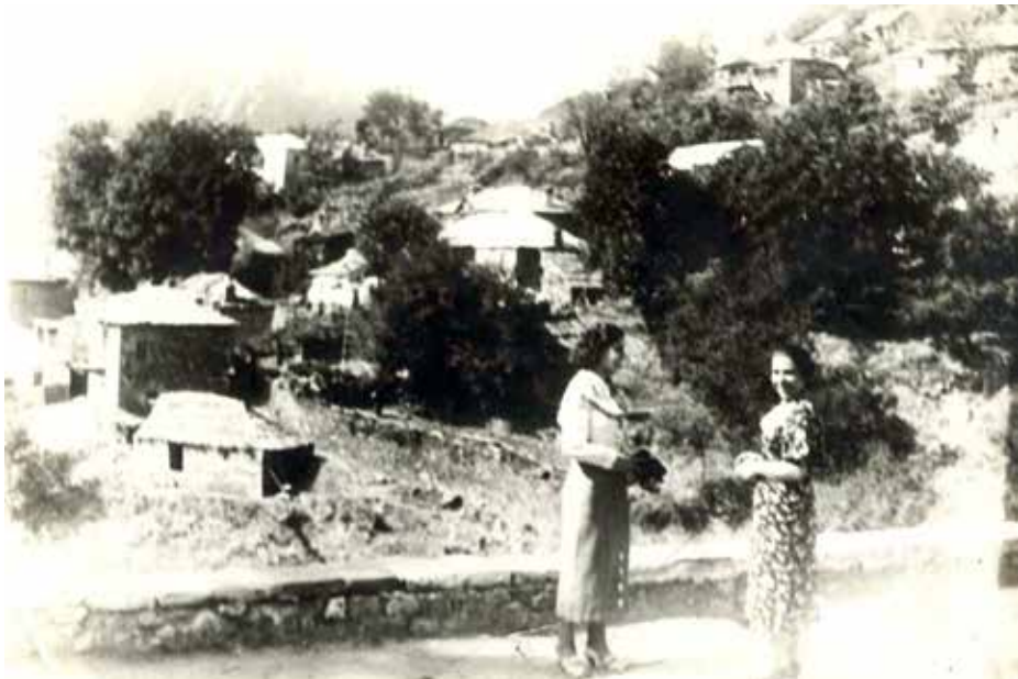
Άποψη της Καρύτσας πριν απ' το κάψιμο του χωριού. Αυτή ακριβώς την εικόνα έβλεπαν οι Γερμανοί στις 29-11-1943, όταν πυρπολούσαν το χωριό απ' το προαύλιο του Αη-Γιάννη.

Απ' το φθινόπωρο, κιόλας, του 1942 άρχισε στην περιοχή μας να φουντώνει το αντάρτικο και η Αντίσταση κατά των εχθρικών στρατευμάτων κατοχής, κίνημα που μέρα με τη μέρα γιγαντώνονταν. Τον επόμενο χρόνο (1943) το κίνημα αυτό είχε κυριολεκτικά θεριέψει. Η Καρύτσα Δολόπων (Ευρυτανίας τότε), ευρισκόμενη σε υψόμετρο 1.180 μέτρων και φυσικά οχυρωμένη από πανύψηλες βουνοκορφές των Αγράφων, αποτέλεσε κέντρο σημαντικών δραστηριοτήτων του ΕΑΜ και έδρα πολλών αντάρτικων συνεργείων που λειτουργούσαν ασταμάτητα [όπως τα