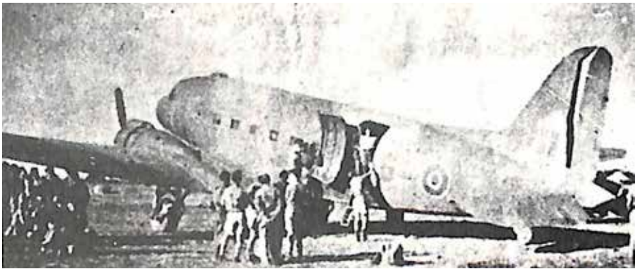
Αεροπλάνο: Το βρήκε η αυγή στο ανártικο αεροδρόμιο, καθώς ένας τροχός βούλιαξε. Θα σκεπαστεί με κλαδιά. Το βράδυ θα το ξεκολλήσουν τα... βουβάλια και θα πετάξει

Αργότερα το αεροδρόμιο τελειοποιήθηκε και χρησιμοποιήθηκε για την προσγείωση και απογείωση μικρών στρατιωτικών αεροπλάνων τύπου ΝΤΑΚΟΤΑ. Ήταν τόσο καλά καμουφλαρισμένο που δεν ήταν εύκολο να επισημανθεί από τον εχθρό. Τόσο πολύ ήταν άορατο, ώστε οι Άγγλοι που το κατασκεύασαν στάθηκε αδύνατο να το αναγνωρίσουν. Ο ταξίαρχος Έντυ γράφει: "Μια εβδομάδα πριν έρθει το πρώτο αεροπλάνο που περιμέναμε, η ΡΑΦ έστειλε απροειδοποίητα ένα αναγνωριστικό από τη Μέση Ανατολή για να πάρει φωτογραφίες. Οι φωτογραφίες εμφανίστηκαν και μελετήθηκαν στο Κάιρο και σχετικά μ αυτές, οι παράγοντες του Καΐρου, μας έστειλαν μια πλήρη έκθεση με την παρατήρηση ότι στο έδαφος υπήρχαν εμπόδια που έμοιαζαν με θημωνιές και συστάδες από θάμνους