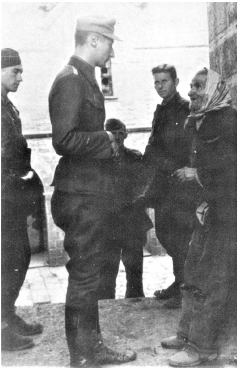
Ο νεωκόρος της 1.Μ Κορώνας, ο μοναδικός που είχε απομείνει στην Μονή, ανακρίνεται από αξιωματικό ασφαλείας των SS. Μετά από λίγο θα εκτελεστεί από τον ίδιο.