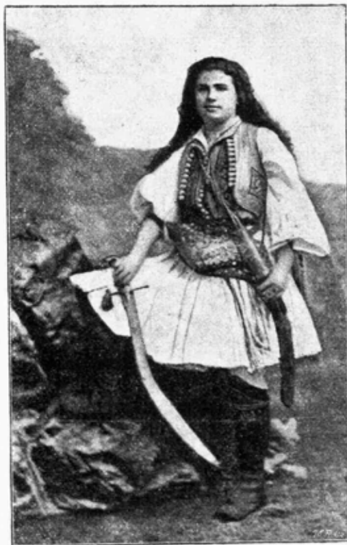
Η ΗΡΩΙΣ ΤΗΣ ΜΑΚΡΥΝΙΤΣΗΣ ΜΑΡΓΑΡΙΤΑ ΜΠΑΣΔΕΚΗ

Το φαινόμενο γίνεται πιο έντονο στις περιόδους των επαναστατικών κινημάτων, οπότε οι γυναίκες ζώνουν τα άρματα και πολεμούν γενναία, ισάξια αν όχι ανώτερα και από τους άντρες σε κάποιες περιπτώσεις, όπως η Μαργαρίτα Μπασδέκη στο Πήλιο στα χρόνια της Επανάστασης του 1878, η οποία οδήγησε στην απελευθέρωση της Θεσσαλίας το 1881.