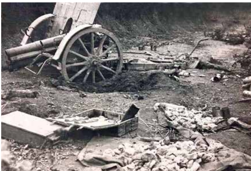
Το Ιταλικό κανόνι που εγκατέλειψε ο ΕΛΑΣ στη μάχη της Νευρόπολης.