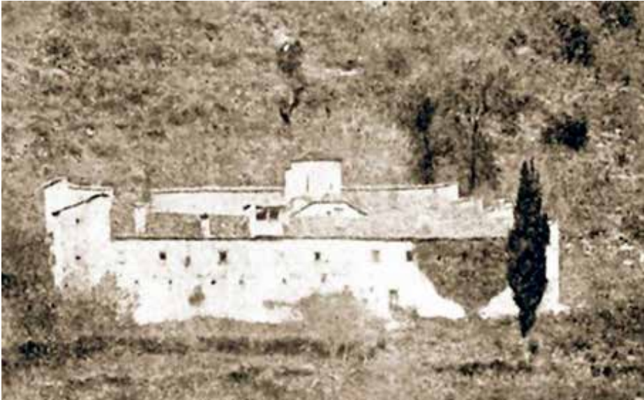
Αγία Τριάδα Βουνεσίου, ένα περίπου χρόνο πριν καεί από τους Ιταλούς κατακτητές, η μοναδική φωτογραφία που διασώζει το Μοναστήρι πριν καταστραφεί ολοσχερώς

Το 1917 χειροτονήθηκε διάκονος λαμβάνοντας το όνομα Δαμασκηνός. Λίγο αργότερα χειροτονήθηκε πρεσβύτερος και ως Αρχιμανδρίτης πλέον ανέλαβε την ηγουμενία της Ι. Μονής Κορώνης, για λίγο ωστόσο διάστημα. Ο τότε Αρχιεπίσκοπος Μελέτιος Μεταξάκης, αξιολογώντας τις δυνατότητές του, τον κάλεσε στην Αθήνα ως διευθυντή των γραφείων της Αρχιεπισκοπής και αλληλοδιαδόχως ηγούμενο των Μονών Πεντέλης και Πετράκη, οπότε και ξεκινά η ανέλιξή του στα υψηλότερα σκαλιά της Ιεραρχίας.