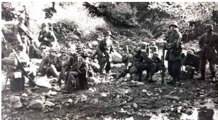
Γερμανοί στρατιώτες σε ρέμα της Νευρόπολης, Νοέμβριος 1943

Το εκτεταμένο όμως μέτωπο των 20 χιλιομέτρων (Μπόσκλαβο — Ελληνόπυρ-