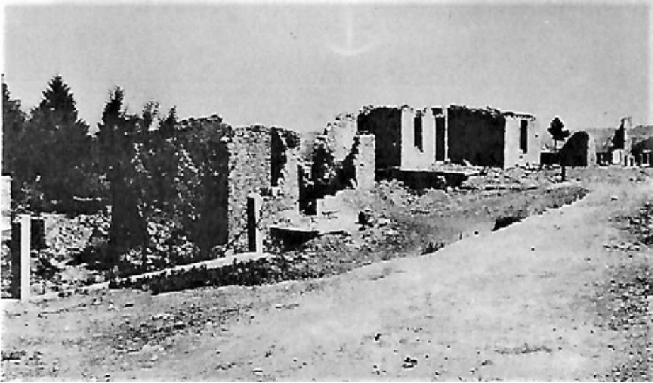
Ολοκληρωτική η καταστροφή της Νεράιδας. Οι Γερμανοί ανατίναξαν ακόμη και τις πηγές.

θα επιστρέψουν ίσως 4.000. Οι υπόλοιποι; Άλλοι χάθηκαν, άλλοι παρέμειναν σε κάποιο χωριό, άλλοι πέθαναν από το κρύο και από την πείνα. Μερικούς αντάρτες τους πήρε και αυτούς για πάντα ο πάγος τα βράδια που πέρασαν στους πρόχειρους καταυλισμούς», θα γράψει ένας Ιταλός ερευνητής.