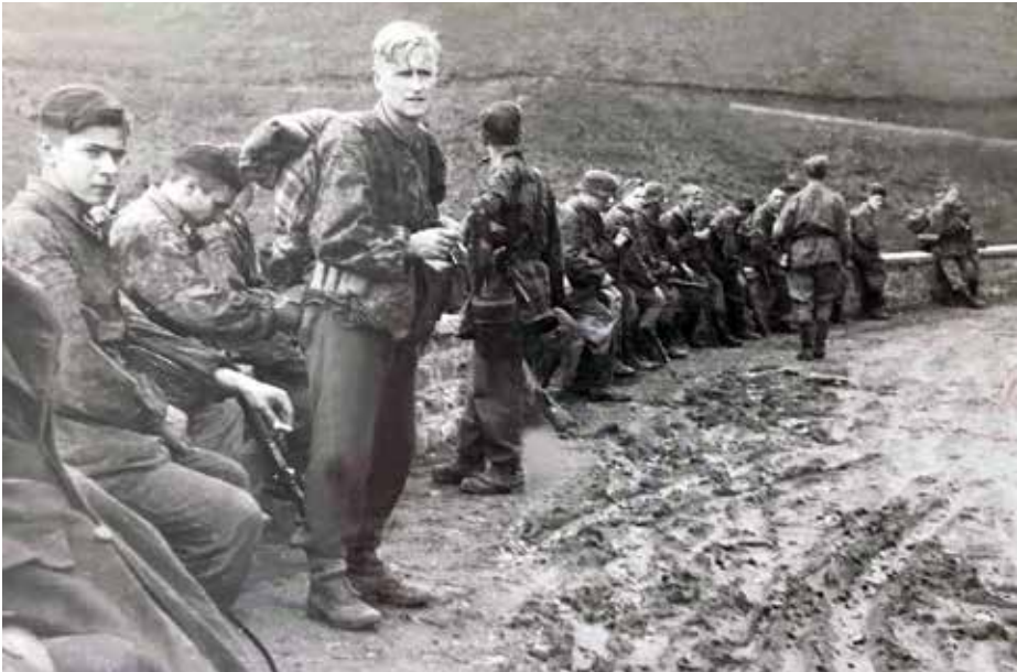
Γερμανική μονάδα κάτω από την Κορώνη, λίγο πριν το κάψιμο του μοναστηριού, 3/12/1943

Μεσενικόλας: Κήκαν από τα 222 σπίτια από τα 309 και εκτελέστηκαν οι άμαχοι: Ζαχαρή Χαρίκλεια, Καρασιώτος Αναστάσιος, Μαστραπάς Γεώργιος, Μηλιώνης Ιωάννης, Μηλιώνης Ευάγγελος, Τσιλιώνης Σωτήριος, Τσαγανός Βασίλειος, Σφέτσιου Αριστέα. Επίσης οι Γερμανοί σκότωσαν σε άλλη χρονική στιγμή τους: Καραμήτρο Δημήτριο, Καραμήτρο Γεώργιο, Καλαμάτα Αριστέιδη, Μπαλάφα Γεώργιο και Μπουμπουλίδη Σωτήριο.