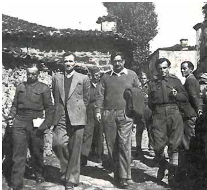
Κλιμάκιο υπουργών (Γ. Ζέβγος, Θεμ. Τσάτσος) και ο Π. Ρούσος φθάνουν στο Αεροδρόμιο