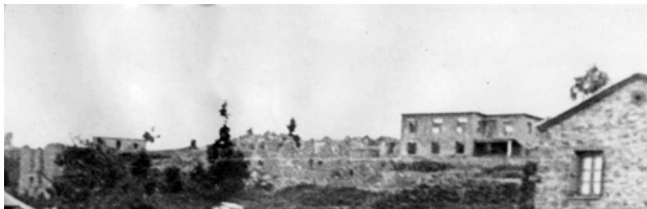
Νεράιδα καλοκαίρι 1953, δέκα χρόνια μετά τα αποκαϊδια είναι εδώ.

Ως σύμβολο φιλίας και αδελφοσύνης, όπως αυτές διαμορφώθηκαν στην πολύμηνη φιλοξενία, κάτω από τις πλέον αντίξοες συνθήκες, πολλών χιλιάδων Ιταλών στις οικογένειες των χωριών των νομών Καρδίτσας και Τρικάλων.