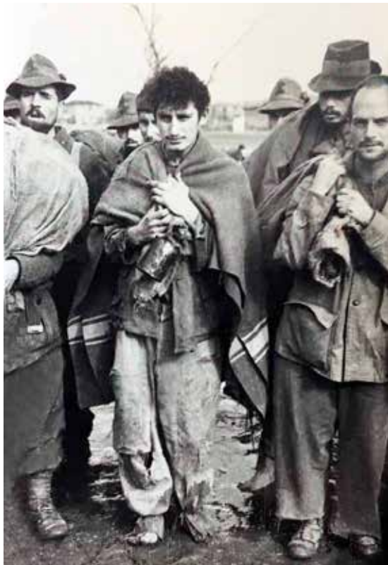
Ιταλοί αιχμάλωτοι των Γερμανών από το στρατόπεδο της Νεραΐδας