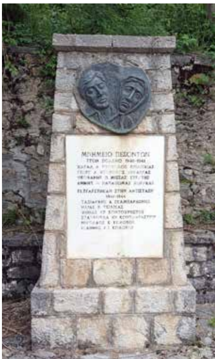
Μνημείο Πεσόντων Καρίτσας