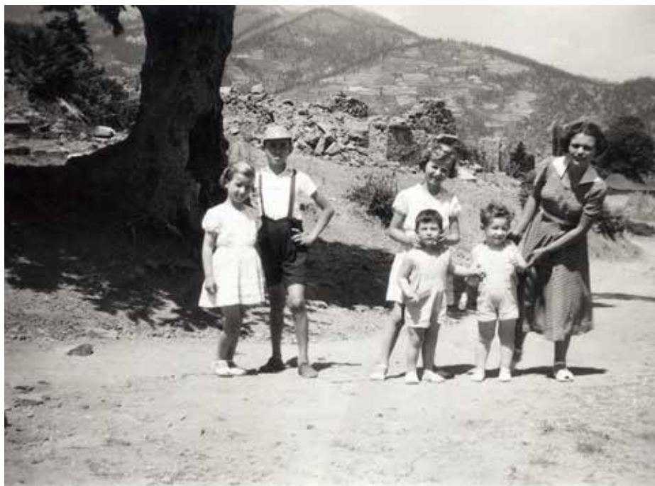
Παιδιά παραθεριστών στη Νεράιδα δεκαετία 1950. Πίσω από την παιδική αθωότητα τα ερείπια σπιτιών από το κάψιμο των Γερμανών το 1943