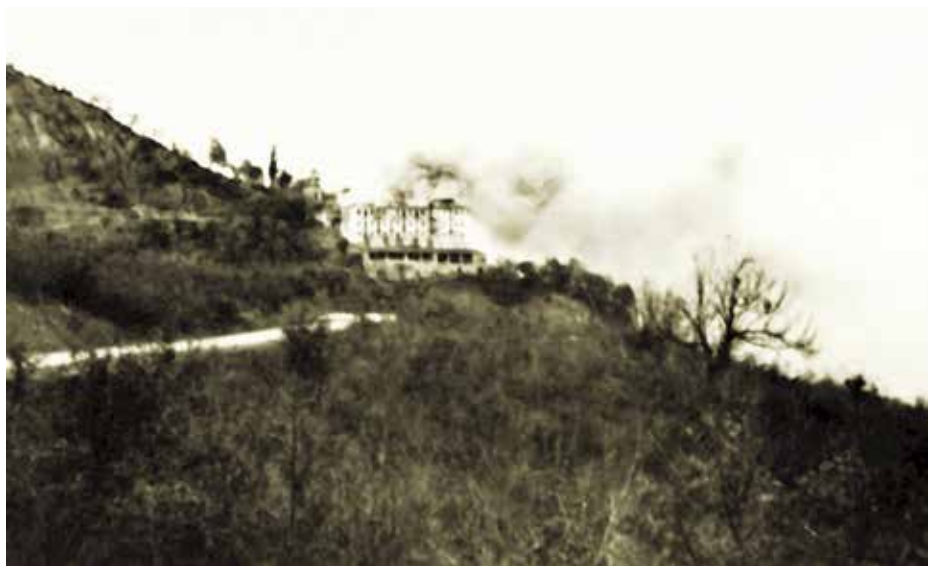
Οι Γερμανοί καίνε το μοναστήρι της Κορώνας, 3/12/1943