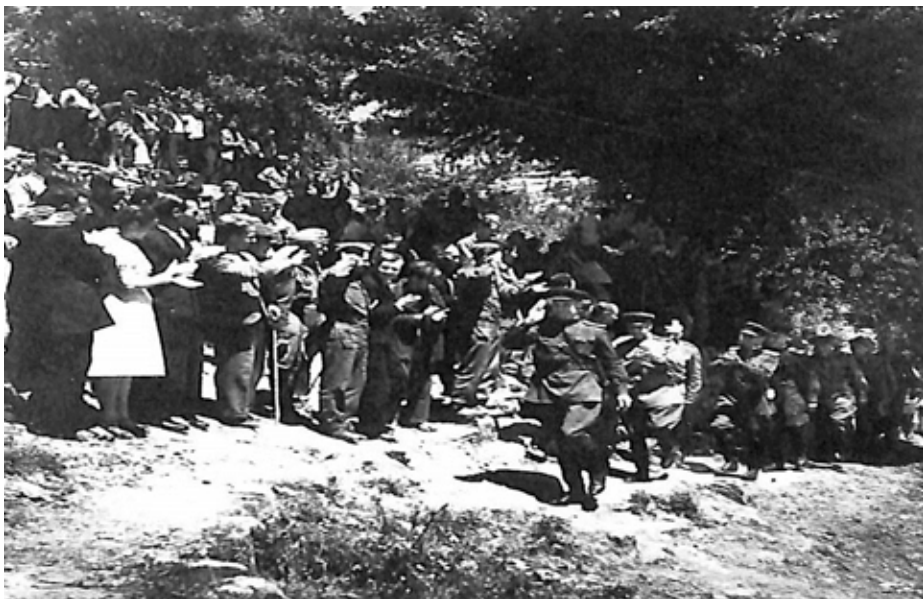
Υποδοχή στη Σοβιετική Στρατιωτική Αποστολή, που έφθασε στο Αεροδρόμιο στις 28 Ιουλίου 1944