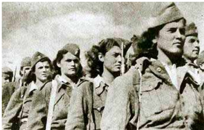
Νέες ένοπλες γυναίκες στον ΕΛΑΣ

Στον πανεθνικό αγώνα Αντίστασης στους κατακτητές σημαντική ήταν η συμβολή της Νεολαίας. Μέσα από την ΕΠΟΝ δημιουργήθηκε πρωτόγνωρος πολιτισμός και συνέβαλλε στην ανάπτυξη της λαϊκής συμμετοχής των νέων αλλά και για πρώτη φορά ισότιμη πρόσβαση των κοριτσιών σε θεσμούς όπως η Τοπική Αυτοδιοίκηση, κ.α. Ξεχωριστή ήταν η συνεισφορά στη χειραφέτηση των νέων γυναικών, ο ρόλος των οποίων δεν έχει αναδειχθεί όσο θα έπρεπε, ιδιαίτερα η συμβολή των αγροτιστών στην ένοπλη αντίσταση αλλά και στις μεγάλες κινητοποιήσεις.