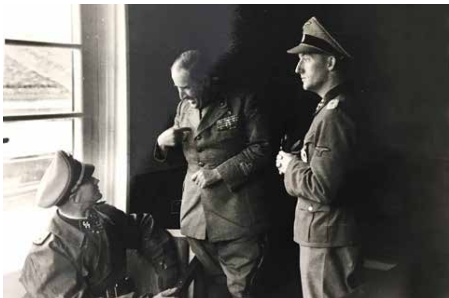
Ο αντισταγματάρχης των SS Κάρλ Σύμμερς καθήμενος επικεφαλής των γερμανικών επιχειρήσεων, συζητά στη Νεραίδα με τον προδοθέντα Ιταλό ταξίαρχο Τζοβάνι Ντελ Τζιούντισε

Αφηγείται ο πεζικάριος Κάρλο Καπρέτι σχετικά: «Είδα τα κοράκια να πετούν πάνω από τις κοντινές οροσειρές, να κατεβαίνουν αργά με φαρδύς κύκλους, κραυγάζοντας πένθιμα. Ετοιμάζονταν για γλέντι. Αυτή η κραυγή μου έρχονταν σαν αναγγελία θανάτου. Την αισθάνομαι ακόμα μέσα μου, μετά από τόσα χρόνια».