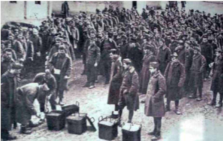
Συσσίτιο Ιταλών αιχμαλώτων (1943)

Αυτή η φιλοξενία των χιλιάδων Ιταλών στα Αγραφιώτικα χωριά, πολλοί εξ αυτών σε σπίτια που έκαψαν οι ίδιοι οι Ιταλοί, στοιχειοθετεί μέγιστη ανθρωπιστική αντιμετώπιση, ψυχικό σθένος και μεγαθυμία που δεν απαντάται εύκολα στην παγκόσμια Ιστορία. Οι πρόγονοί μας είναι ίσως από τα ελάχιστα, αν όχι μοναδικά, παραδείγματα στον κόσμο, όπου οι κατεστραμμένοι περιθάλπουν και φιλοξε-