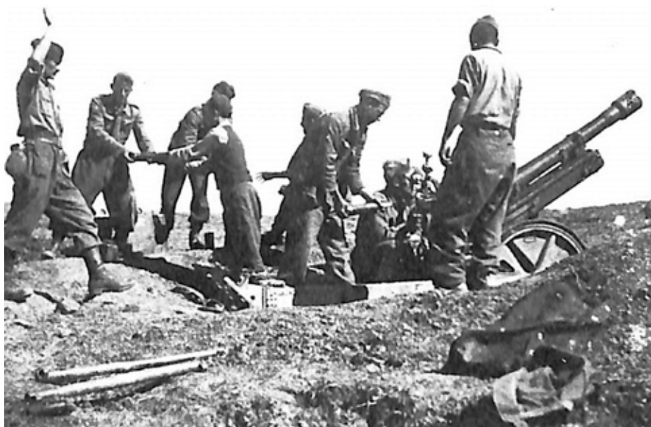
Οι Αντάρτες υπερασπίζονται το Αεροδρόμιο της Νευρόπολης

-Θέλεις μια φέτα ψωμί με δυο ελιές να φας;- Όχι μάνα, εγώ καίγομαι από τον πυρετό. Μόνο μια γουλιά νερό, για να δροσιστώ. Μετά θα γύρω να κοιμηθώ! Όλες οι οικογένειες κοντά στον έλατο είχαν φωτιά, τα βράδια έκανε δυνατό κρύο, έπρεπε να ζεσταίνονται. Οι οικογένειες ζεσταίνονται οι κάτοικοι πριν πάνε για ύπνο κάτω από τις βελέντζες.