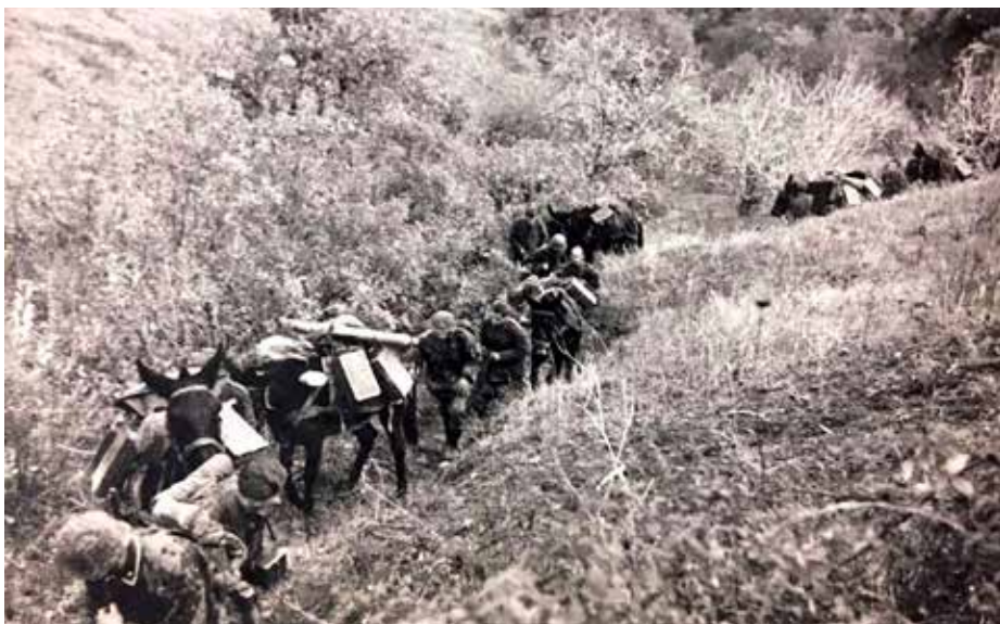
Γερμανοί ανεβαίνουν με τα μουλάρια φορτωμένα με πολεμικό εξοπλισμό και επιχειρούν να προσεγγίσουν την Νευρόπολη από μονοπάτια με στόχο να αιφνιδιάσουν τους αντίρτες.