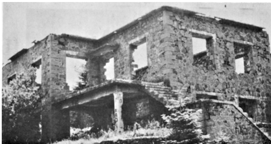
Καμμένη εξοχική κατοικία της οικογένειας Κατσάρη, δεκαετία 1960