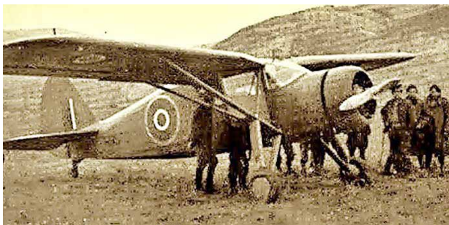
Αεροπλάνο στο Αντάρτικο Αεροδρόμιο

Στις 28 Ιουλίου 1944 προσγειώνεται σοβιετικό μικρό αεροπλάνο με 8 αξιωματικούς με επικεφαλής τον συνταγματάρχη Ποπώφ για να πληροφορηθούν για την πορεία του αγώνα. Στις 2 Σεπτεμβρίου 1944 αναχωρούν από το αεροδρόμιο για το Κάιρο, να ορκισθούν ως υπουργοί στην κυβέρνηση εθνικής ενότητας οι Σβώλος, Ζέβγος, Πορφυρογένης, Τσιριμώκος και Ασκούτσης. Η διαδικασία προσγείωσης και απογείωσης σε ένα πρόχειρο αεροδρόμιο χωρίς ασφαλή διάδρομο είχε και τα ευτράπελα. Κατά την προσγείωση αεροπλάνου που έφερε τον Άγγλο ταξιαρχο Μπένφιλ, ο ένας τροχός βούλιαξε στο λασπωμένο από τη βροχή έδαφος και το αεροπλάνο δεν ξεκόλαγε να πετάξει. Ξημέρωσε και χρειάστηκε να καλυφθεί με κλαδιά δέντρων να μην εντοπισθεί από γερμανικά αναγνωριστικά. Από τον κάμπο της Καρδίτσας επιστρατεύονται γρήγορα μερικά βουβάλια τα οποία το έσυραν από τη λάσπη και μόλις νύχτωσε αναχώρησε για τον προορισμό του.