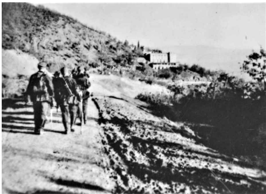
Γερμανοί στρατιώτες στις 3/12/1943, προσεγγίζουν το μοναστήρι της Κορώνας, το οποίο σε λίγο ώρα θα κάψουν